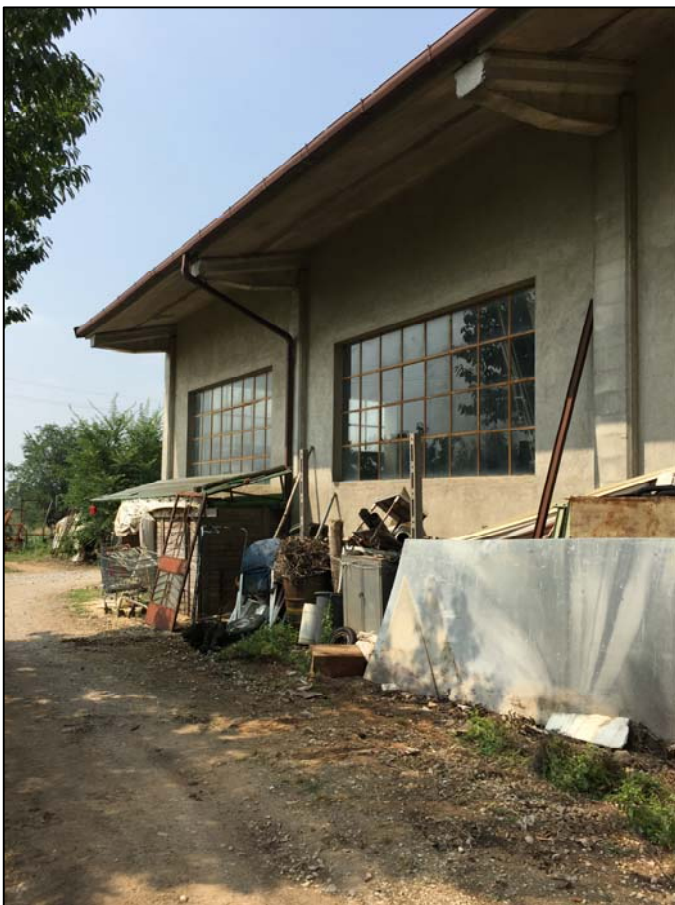
Fotografia n. 2

DOTT. STEFANO PISTONI INGEGNERE CIVILE ORDINE DEGLI INGEGNERI PROVINCIA DI BRESCIA N. 3897 "SEZ A"