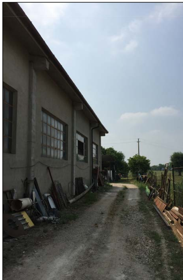
Fotografia n. 3