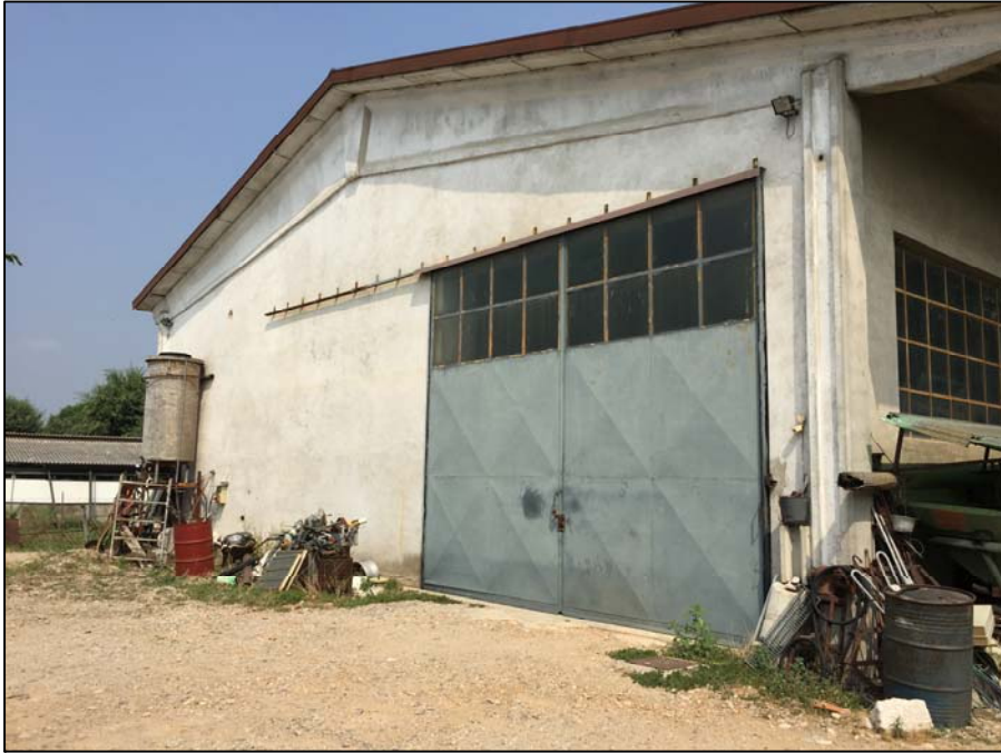
Fotografia n. 1

DOTT. STEFANO PISTONI INGEGNERE CIVILE ORDINE DEGLI INGEGNERI PROVINCIA DI BRESCIA N. 3897 "SEZ A"